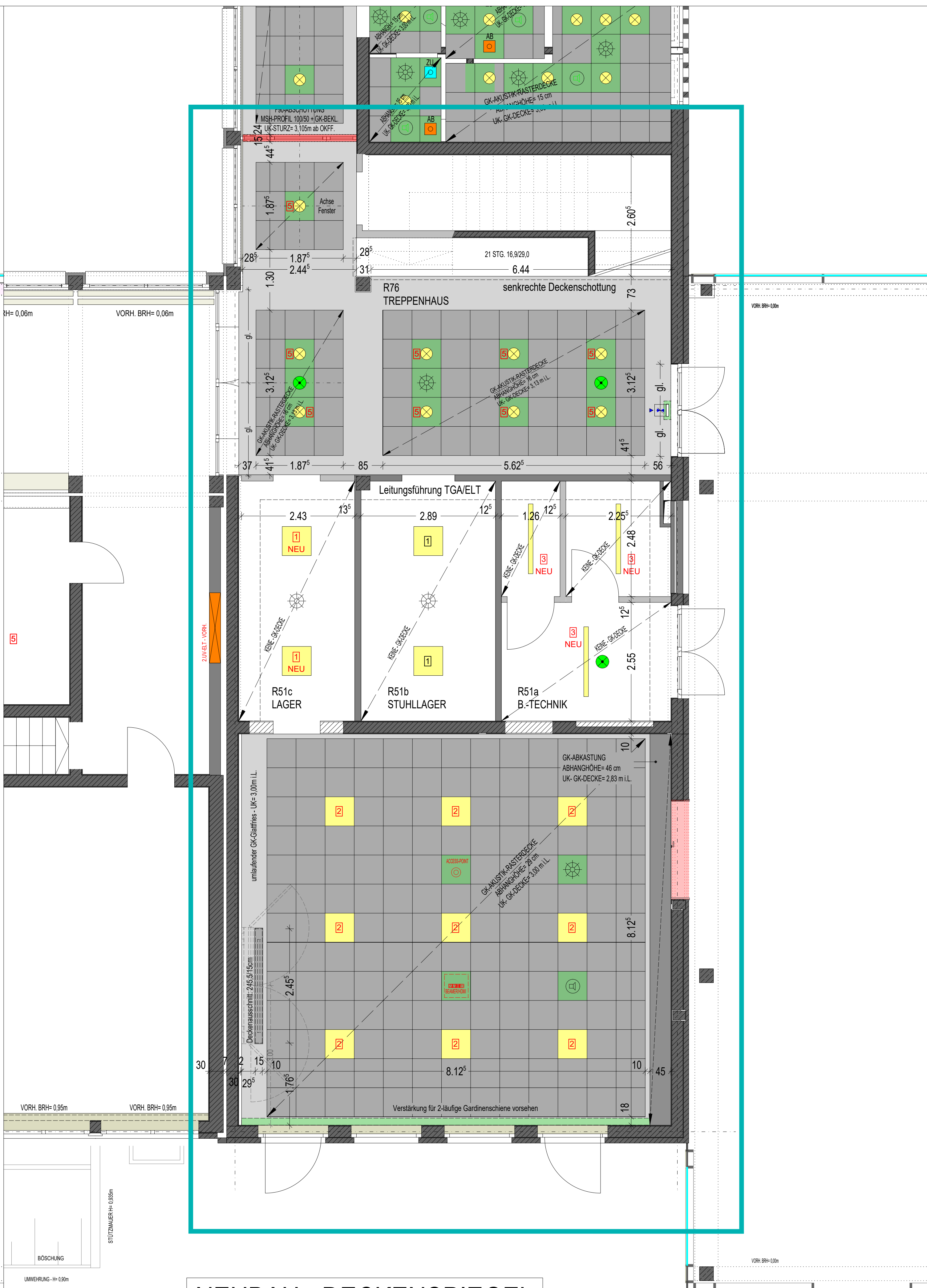
NEUBAU - DECKENSPIEGEL